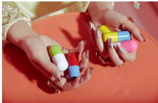
Vogue India

21/01/2017 - 07h57 - Atualizado 09h30 / por CAMILLA BELLO