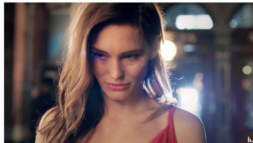
inFeed invented by Teads